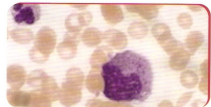
Detalle microscópico de parásito ( Ehrlichia )

Para más información consulte con su veterinario